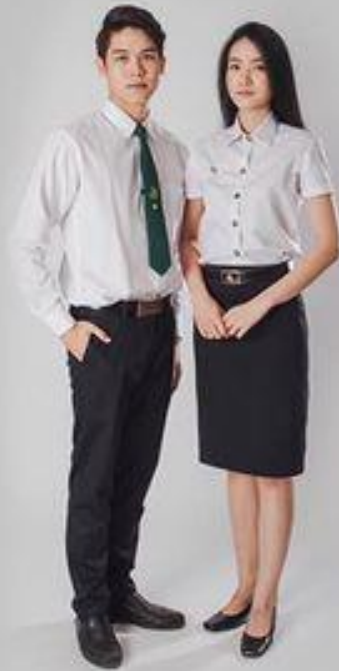
ชุดพิธีการ