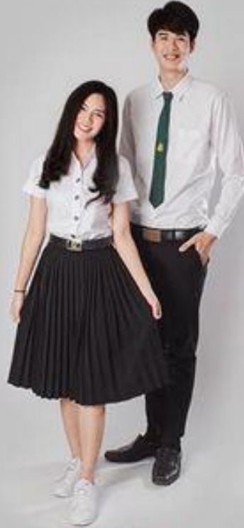
ชุดนิสิต